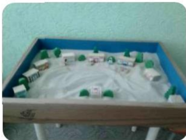
Набор «Песочная магия»